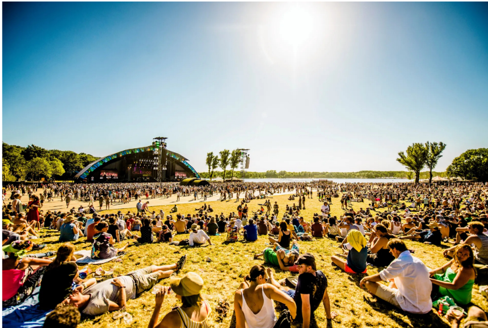
Het Down The Rabbit Hole Festival in 2018 bij Wijchen. Voor de editie van 2023 kochten de organisatoren stikstofruimte op bij nabijgelegen veehouders die vereist is voor een vergunning.

Festivalorganisatoren kopen op verschillende plekken in Nederland stikstofruimte op van boeren om hun festival deze zomer te kunnen laten doorgaan. Daarmee voegen ze zich in het rijtje van projectontwikkelaars, provincies en grote bedrijven als Schiphol en FrieslandCampina, die zich ook melden voor de uitstootrechten van veehouders die stoppen met hun bedrijf. Dat blijkt uit onderzoek van NRC.